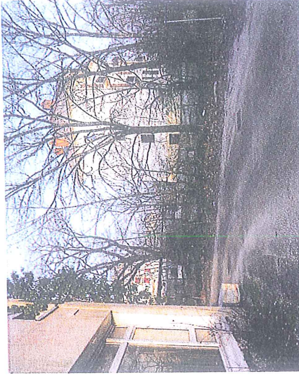
Vue 02 - PHOTOGRAPHIE PROCHE (Décembre 2013)